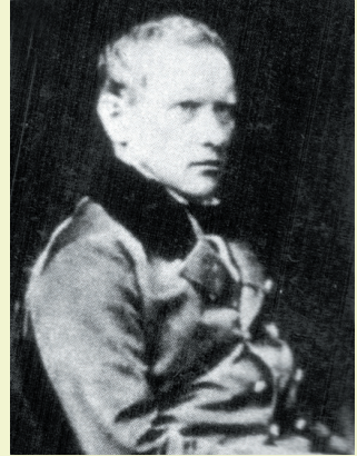
А. О. Валицький

Здобуті під час навчання в Харківському університеті знання сприяли становленню М. Костомарова як багатогранної особистості – науковця, письменника і громадського діяча. Він зумів виявити себе в різних галузях. Харківський період життя М. Костомарова ознаменувався не тільки науковою, а й літературною діяльністю. 1838 р. була надрукована драма «Сава Чалий», 1840 р. – повість «Сорок літ», а 1841 р. – трагедія «Переяславська ніч». Поезії, що увійшли до збірок «Українські балади» (1839) та «Вітка» (1840), написані в романтичному стилі. М. Костомаров також став автором казок «Торба», «Лови», повісті «Казка про дівку Семилітку». Як письменник-романтик, М. Костомаров був переконаний, що його літературна творчість покликана зберегти українську мову та духовні традиції для нащадків.