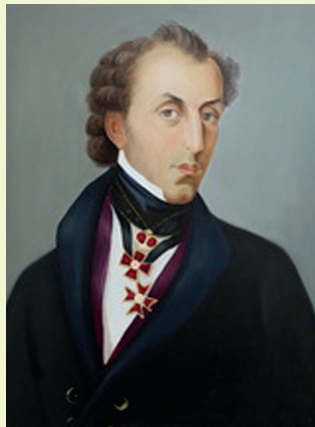
П. П. Гулак-Артемівський

Корд» (1862), повісті «Син» (1869), «Кудеяр» (1875), «Чернігівка» (1881); переклади творів Дж. Байрона, У. Шекспіра і «Краледворського рукопису».