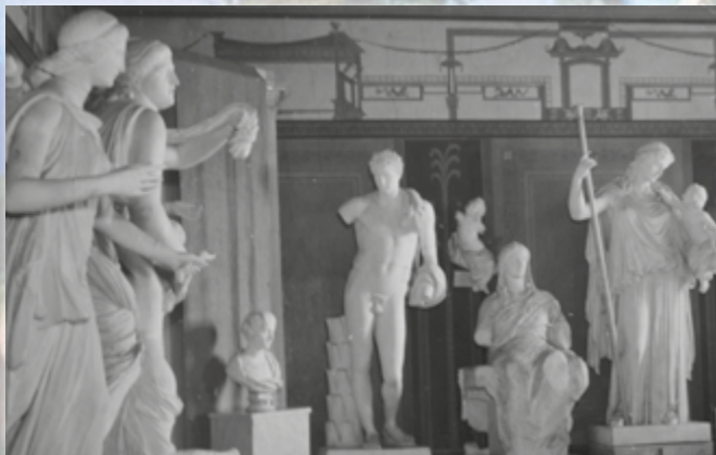
Фрагмент експозиції Музею витончених мистецтв Харківського імператорського університету