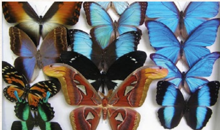
Метелики — експонати ентомологічного зібрання Музею природи Харківського національного університету імені В. Н. Каразіна

При факультеті функціонував зоологічний кабінет, що у наш час перетворився на один з кращих в Україні музеїв природи. Його ентомологічна колекція нараховує більше ніж 200 тисяч екземплярів зі всіх куточків планети.