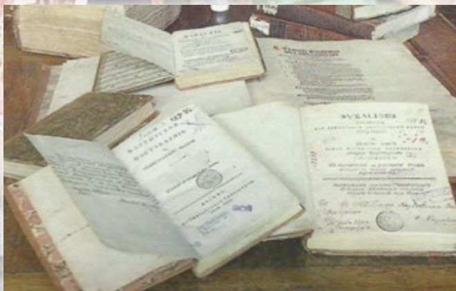
Фундаментальна бібліотека — душа Університету

«Науки і мистецтва повернуться до нашої Вітчизни, вони вважатимуть її за власну»