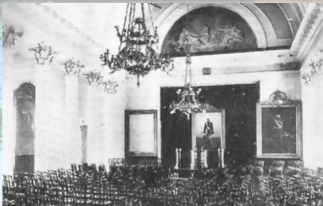
Зал урочистих засідань Харківського університету