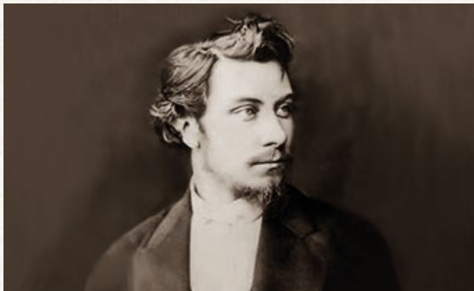
Генрік Іполитович Семирадський у студентські роки

Митець належить чотирьом країнам світу: Україні, Польщі, Росії та Італії.