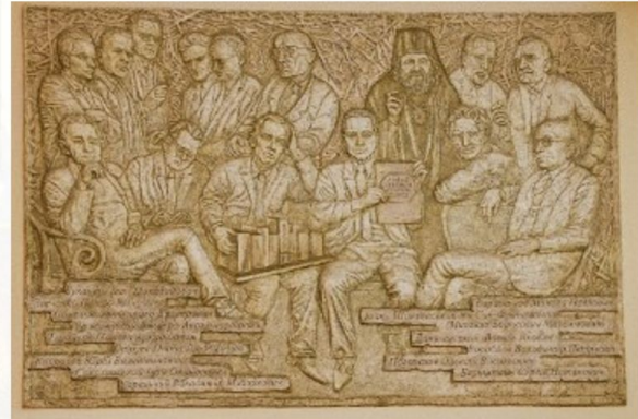
Суханова Н. В. Видатні діячі університетської науки. 2016. Ч. 2. «XX століття».