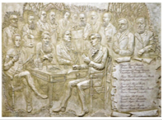
Суханова Н. В. Видатні діячі університетської науки. 2016. Ч. 1. «XIX століття»